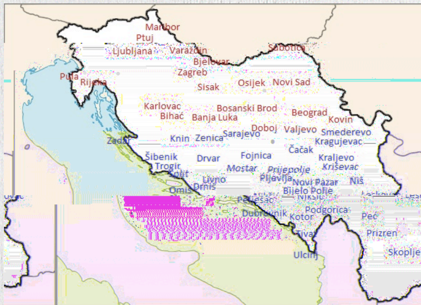
Мапа: Неки од градова који су бомбардовани од стране савезника током 1943. и 1944. године Мапу израдио Милош Вукановић

”Не е б. е Ј 1941. е. е е е е е е 3. е . Г е е Бе , е е е е е е е С , С е , М , Б е , е Бе е е С е, е е. С Бе е , е е В В Бе , е е е Бе 1941. 2.274 б. 7. е е 627 , е е е е е 10.000, С . е е е е е е е е е е 300.000 , е е е е е е е ” ” е е е е е е е е е е е е е е Ј е 1943. е. е е е е е 20. 1943. е е е е е е е е е е е е 1943, е е е е е е е е е е е е е 1944. е. е е е е е е е е е е е е е е е е е е 1943, е е 1944, е е е е е е е е е е е е е е е е е е е е е е е е е е е е е е е е е е е е е М е е Ј е е е е е е С е Ј ( е е е е е е е е е е е е е ) 4. е 1942. е е е В е е е е е е е е е е Ј Б е е 17. 1943. ( е е е е е е е е е е е е е е е е е Бе , Бе , е , А е е, М , е .”